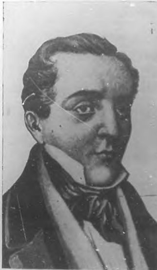
José María Heredia.

Rebelde y liberal, hay un momento en que el General Vives, Gobernador de Cuba, lo sorprende conspirando contra el Gobierno español, y lo destierra de la Isla. Vase entonces á Norte América, desembarcando en Boston. Aquí, el cielo gris reemplaza al claro cielo tropical; mudo el paisaje así mismo, sustituyendo al mon-