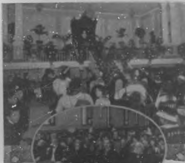
Gran salón de actos del Colegio de Belén y mesa presidencial en la fiesta de la Avellaneda, homenaje rendido á la inmortal poetisa por los alumnos.

El día de Reyes será de alegría intensa para los pequeños, y en esto BOHEMIA cifra su mayor satisfacción.