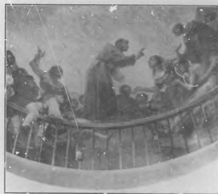
Fragmento (San Antonio) de la cúpula de San Antonio de la Florida, por Goya.

Es de notar la expresión de todos los circunstantes, mezcla de asombro y terror, así como la aptitud de la mujer, que con los brazos extendidos, parece querer dar más fuerza á sus ruegos. Hay en esta mujer un acento de sufrimiento, realmente asombroso y conmovedor, capaz de inspirar compasión á otro