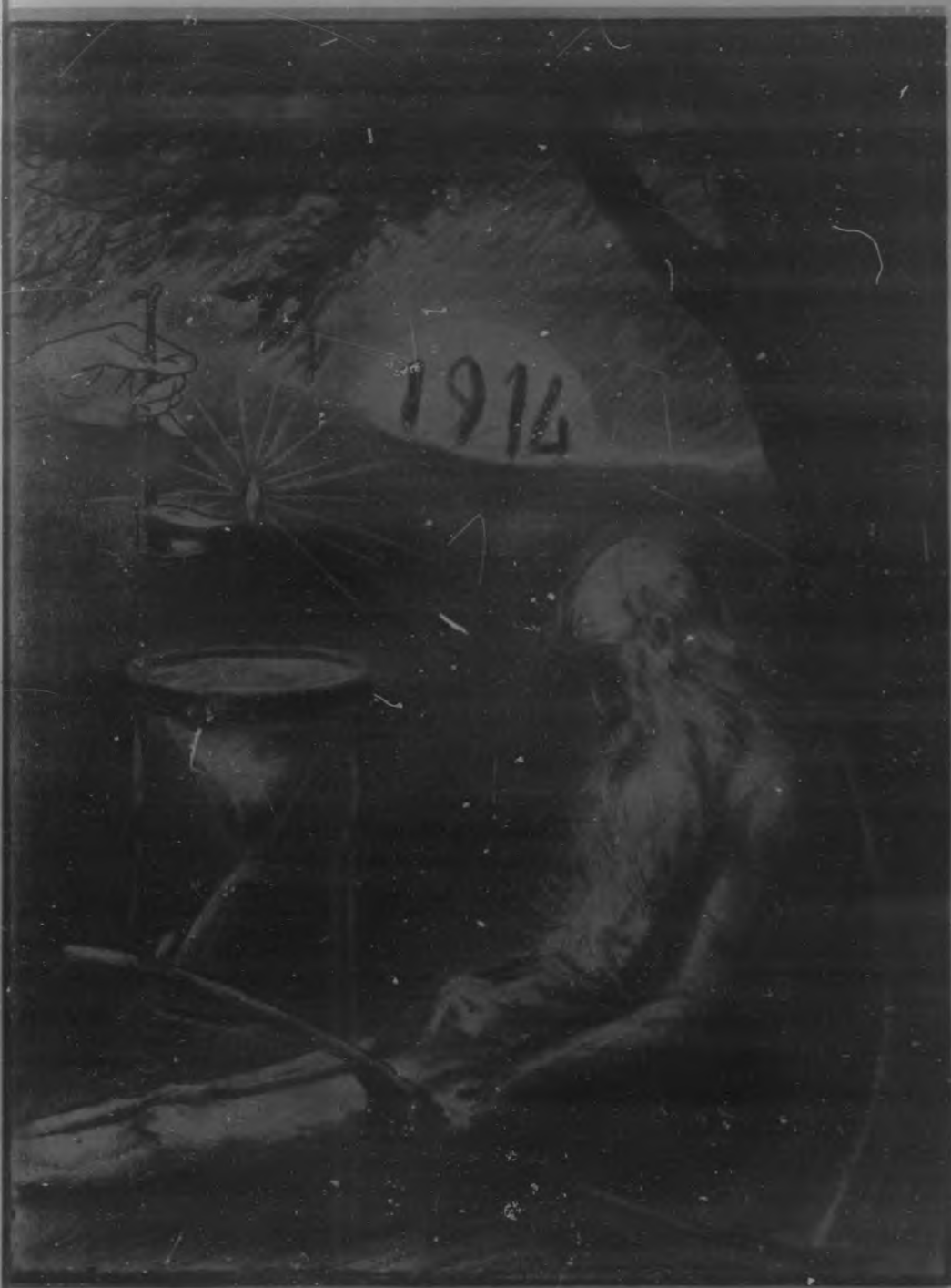
ULTIMOS MOMENTOS DEL AÑO