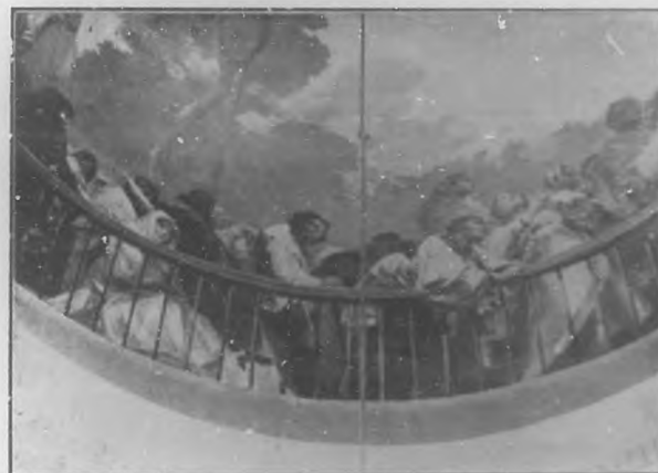
Fragmento de la cúpula en San Antonio de la Florida, por Goya.