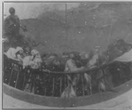
Fragmento de la cúpula de San Antonio de la Florida, por Goya.

hombre que no fuise el santo. Pero en medio de esta escena, hay un detalle magistral: el del curioso chicuelo que contempla con interés un acto tan asombroso como es el de dar la vida á un hombre.