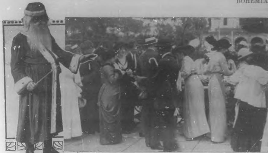
Grupo de damas y caballeros del Bando de Piedad en el acto de la repartición de juguetes, dulces y vestidos á los niños pobres, efectuado en el Parque Central el día 25 del actual.

El entusiasmo que ha despertado entre los niños las carreras es tan