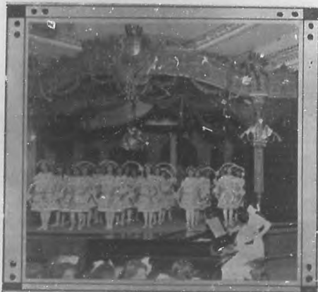
COLEGIO "MARIA TERESA COMELLAS".— Varias alumnas en la "Marcha de las Flores", ejecutada en la Velada que celebró dicho colegio el 20 de los corrientes con motivo de la fiesta anual de repartición de premios.